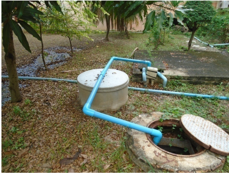
ภาพที่ 4 ระบบกำจัดก๊าซมีเทนของโครงการ

หลักการและเหตุผลการเปลี่ยนระบบกำจัดก๊าซมีเทนที่เกิดจากระบบบำบัดน้ำเสีย จากเดิม เป็นระบบ เตาเผาก๊าซมีเทน เป็นระบบ Bio Filter (Mature Compost Tank)